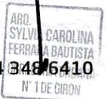
Arq. SYLVIA CAROLINA FERRADA BAUTISTA Curador Urbano No. 1 de Girón

Se expide en Girón, el 09 de abril de 2026 .