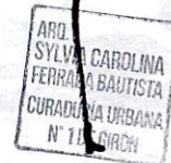
Arq. SYLVIA CAROLINA FERRADA BAUTISTA Curador Urbano No. 1 de Girón

Se expide en Girón, el 22 de enero de 2026 .