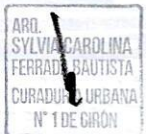
Arq. SYLVIA CAROLINA FERRADA BAUTISTA Curador Urbano No. 1 de Girón

Se expide en Girón, el 22 de julio de 2024.