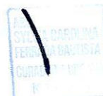
Arq. SYLVIA CAROLINA FERRADA BAUTISTA Curador Urbano No. 1 de Girón

Se expide en Girón, el 11 de abril de 2024 .