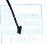
Arq. SYLVIA CAROLINA FERRADA BAUTISTA Curador Urbano No. 1 de Girón

Se expide en Girón, el 13 de marzo de 2024 .